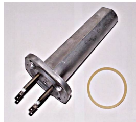
Nouvelle résistance monobloc !

Caractéristiques techniques : 220 v. CE Cuve INOX capacité totale : 5 l Capacité utile : 3,5 l Résistance chaudière : 1500 w. Tube niveau d'eau. Electrovanne à débit réglable. Autonomie : environ 4h00 Pression d'exercice : 3 à 3,5 bar. Vanne de vidange. Caisson monté sur 4 roulettes pivotantes. Livrée avec antenne et tapis repose fer.