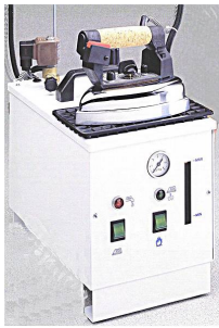
PRATIKA sans caisson